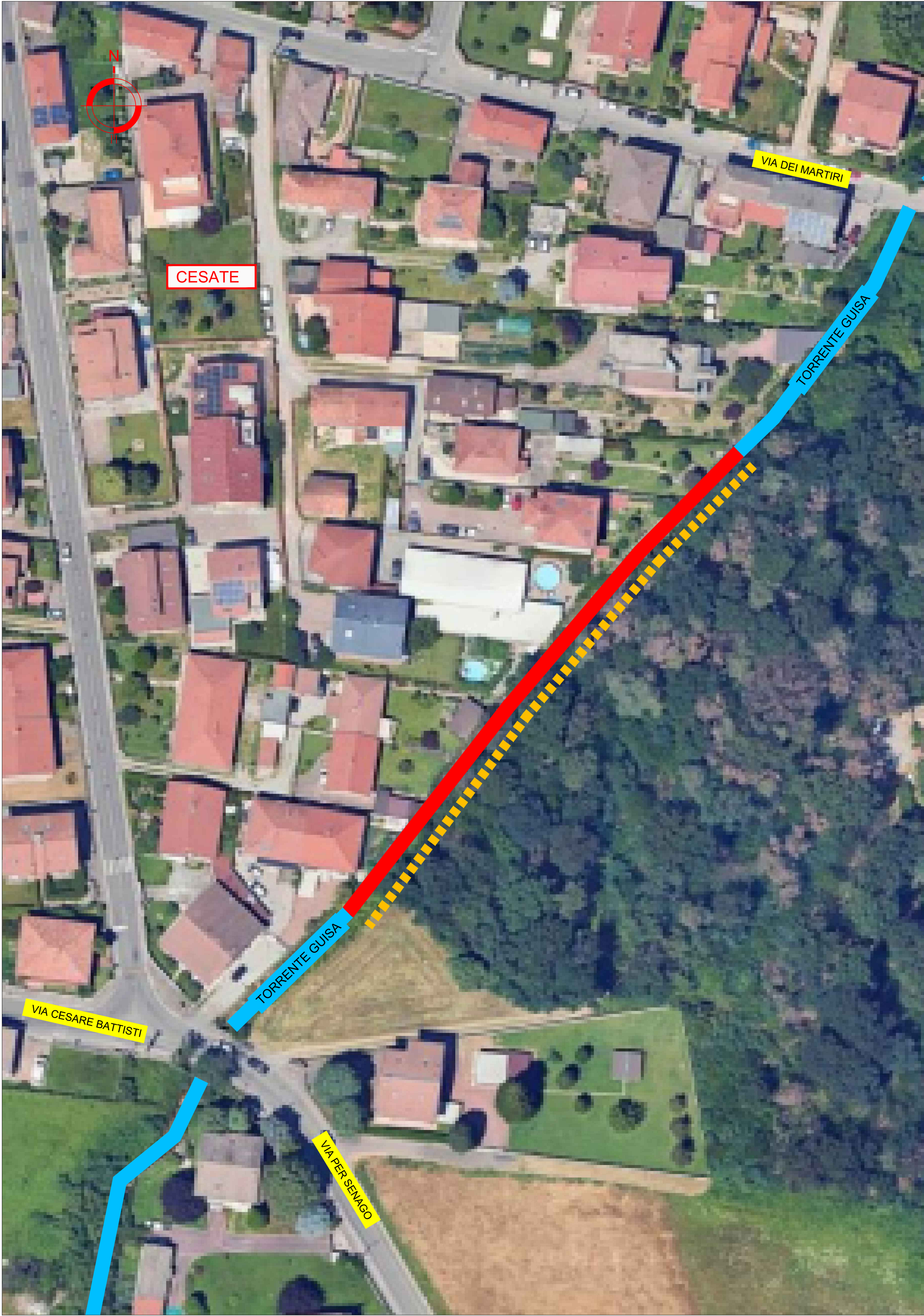
TRATTO DI INTERVENTO SUL TORRENTE MOLGORA